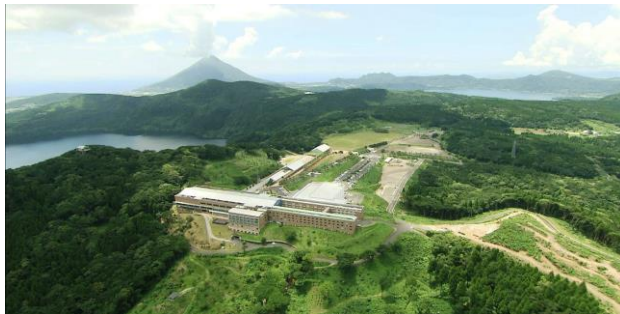
メディポリス指宿全体