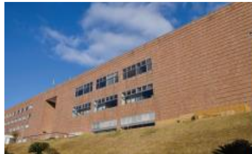
ホテルフリージア