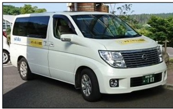
1～5便、7～9便 運行会社 アロハ交通[0993-22-3271]