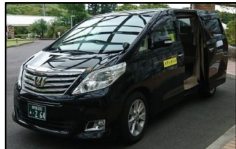
6便 運行会社 第一交通[0993-22-3193]