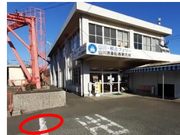
山川港フェリー—なんきゆう 送迎車停車位置