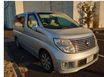
山川港フェリー—なんきゆう 送迎車停車位置