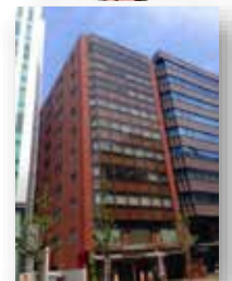
メディポリス国際陽子線治療センターオフィス福岡 (ユナイト博多ビル2階)