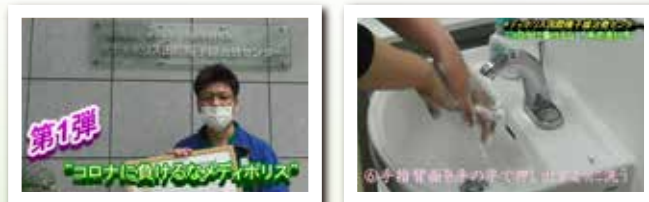
メディポリス YouTuber「第一弾 コロナに負けるな!手洗い方法」