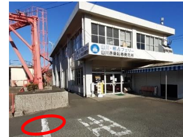
山川港フェリー—なんきゆう 送迎車停車位置