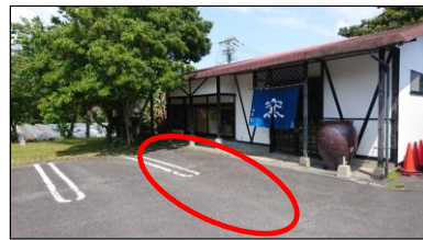
指宿ロイヤルホテル(吟松寮)前