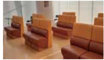
待合室の椅子配置と十分な換気