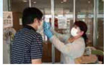
入口にて検温実施

※ ハイクロソフト水 とは、少量の食塩と塩酸を含む水を電気分解した物です。強酸化水の5倍の殺菌効果、次亜塩素酸ナトリウムの50倍の殺菌効果があり、肌や目はもちろん、間違っても飲んで安心です。