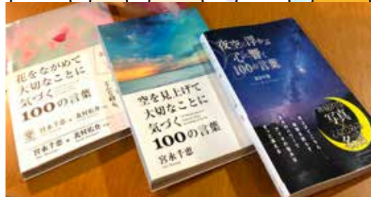
左:花をながめて大切なことに気づく 100の言葉 中:空を見上げて大切なことに気づく 100の言葉 右:夜空に浮かぶ心に響く 100の言葉