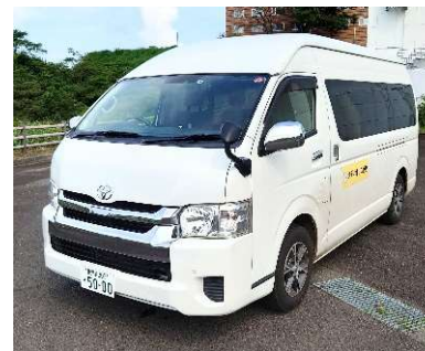
山川港フェリーなんきゅう 送迎車停車位置