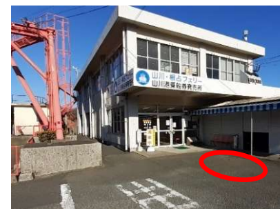
山川港フェリーなんきゅう 送迎車停車位置