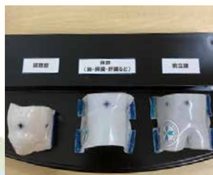
※プレゼント用の手作りミニ固定具