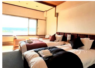
ホテルフリージア客室