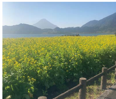
※菜の花畑と開聞岳