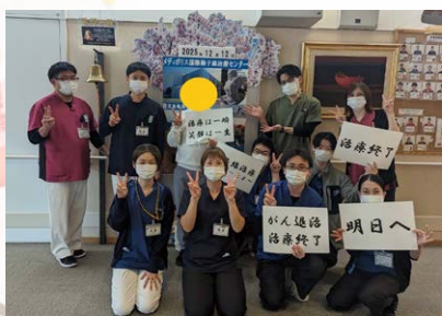
治療終了時の記念撮影 メッセージカードも準備しています

治療スタッフが気持ちを込めて作った治療中、終了時の記念写真撮影スポットや治療終了時の鐘など患者さんの声から生まれた“おもてなし”を治療フロア全てのスタッフが提供しています。