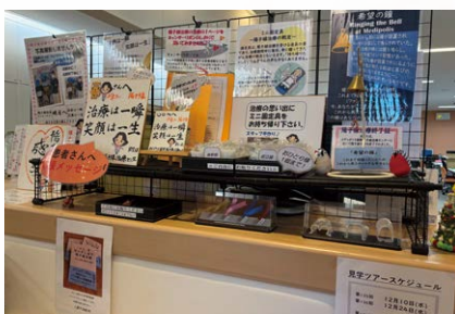
手作りのミニ固定具や応援メッセージ などの“おもてなし”