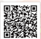
Instagram・Facebook・LINE も更新しております！

さまざまな SNS でメディポリスの情報を発信しております。QR コードを読み込んでいただき、是非ごらんになってください！