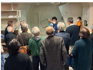
治療中の患者さん・ご家族限定の 施設見学ツアー