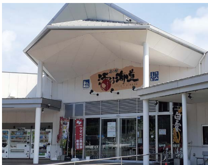
道の駅山川港活お海道