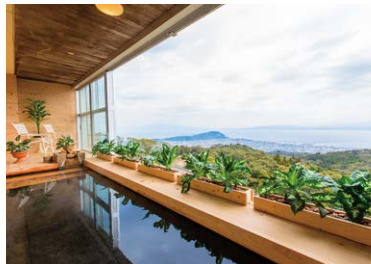
ホテル展望大浴場