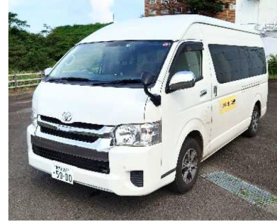
山川港フェリーなんきゅう 送迎車停車位置