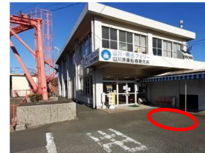
山川港フェリーなんきゅう 送迎車停車位置