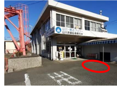
山川港フェリーなんきゅう 送迎車停車位置